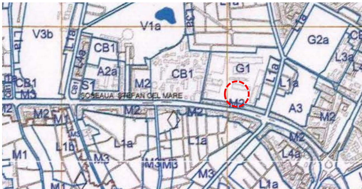
Extras din PUG Municipiul București, aprobat prin HC 269/ 2000

Terenul se află încadrat conform PUG Municipiul București în zona G1 - subzona construcțiilor și amenajărilor pentru gospodărie comunală .