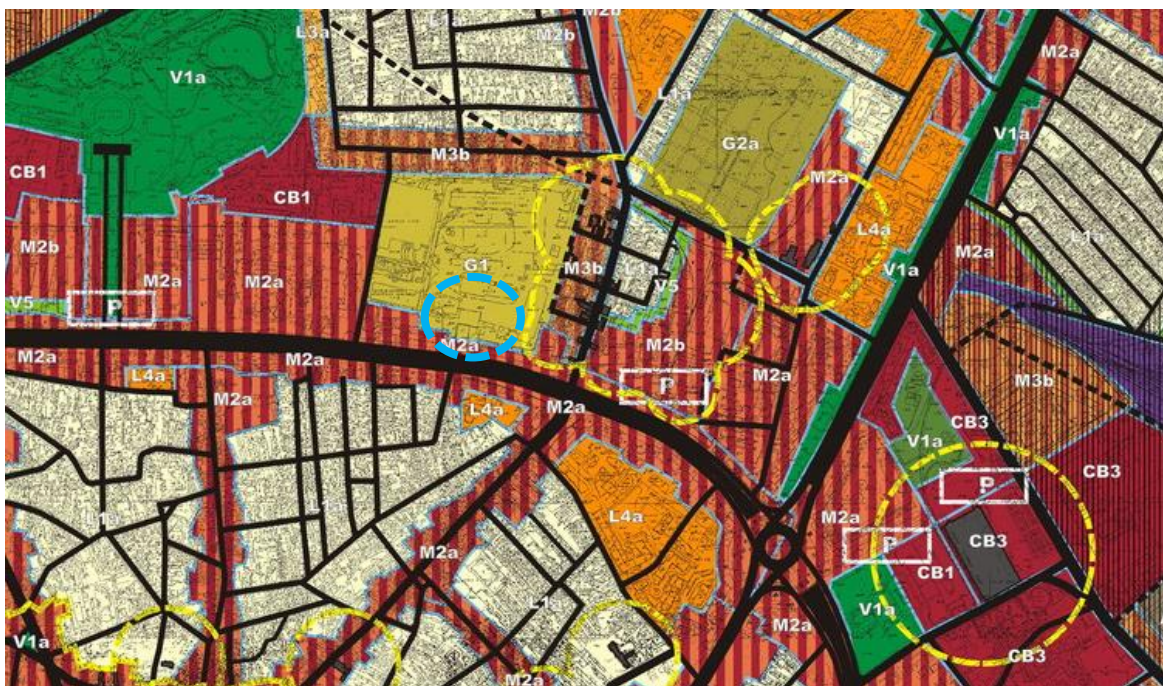
Extras din PUZ Sector 2, aprobat prin HCL nr 99/ 2003, in prezent expirat

În ceea ce privește încadrarea terenului cu nr cadastral 204778 (actuala folosință a terenului fiind de curți construcții) în cadrul reglementărilor PUZ Sector, aflat în etapa de avizare, aceasta urmează a se încadra în zona M – Zona mixtă .