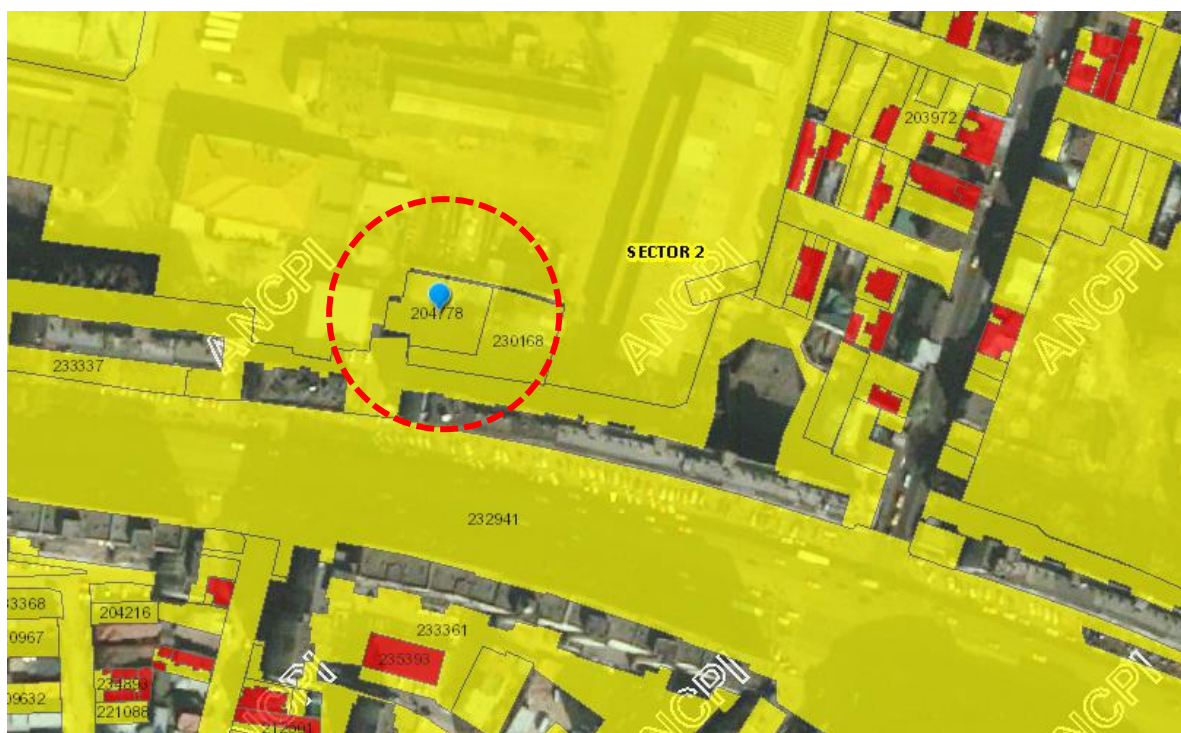
Extras din incadrare ANCPI – Imobile Eterra

Terenul se află încadrat conform PUG Municipiul București în zona G1 - subzona construcțiilor și amenajărilor pentru gospodărie comunală .